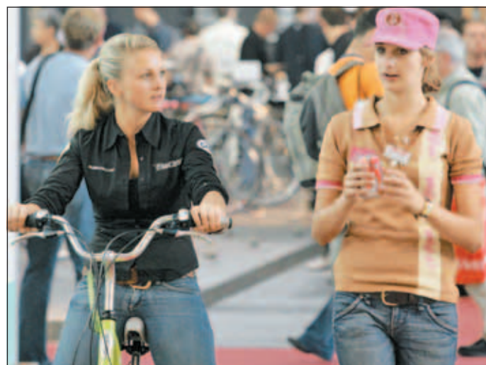
30.000 Besucher aus 69 Ländern reisen zur Ausstellung an.

auf dem neuesten Stand der Technik. „Die Kombination aus Stadt- und Rennrad ist für 25- bis 30-Jährige ansprechend“, weiß Mösslang. Zum vierten Mal ist er in Friedrichshafen dabei und auch er weiß, dass „es die ideale Präsentationsplattform ist“.