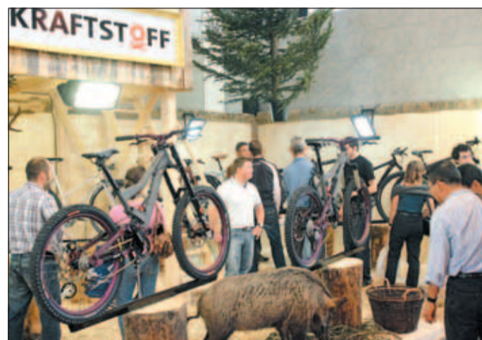
Repräsentiert Vorarlberg: ein Wildschwein im Tannenwald.