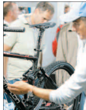
Fachleute prüfen Materialien.