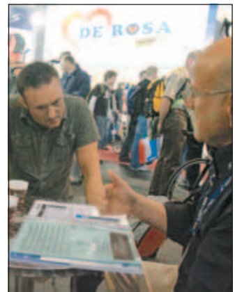
Viel Zeit für Kunden.